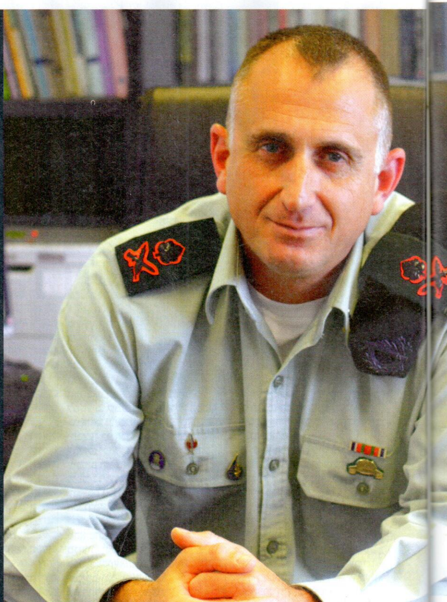
"עלינו להיות צבא שלומד מהר", האלוף תמיר הימן

הקרובה נלמד היטב כיצד אנשים מגיבים למערכת, באמצעות מעקב אחר הכניסות, קבוצות מיקוד ואמצעים נוספים, ציין האלוף הימן. "אנו מקפידים על נושא ביטחון המידע. יש לנו מעקב רציף אחר המשתמשים, על מנת לוודא שאין חריגה, שרק מי שצריך יקבל את המידע מבלי שתהיה פה דליפה. בסופו של דבר אנחנו נמצאים במערכת צבאית היררכית, ויש במאגר הוחרים שלא כולם צריכים להיחשף אליהם. ובכל זאת, עם כל ההרשאות והמגבלות מדובר במהפכה, ואני מקווה מאוד שהמשתמשים ייקחו אותה למקומות הנכונים."